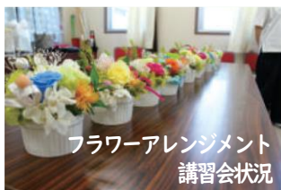
フラワーアレンジメント 講習会状況