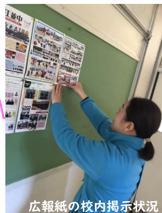
広報紙の校内掲示状況