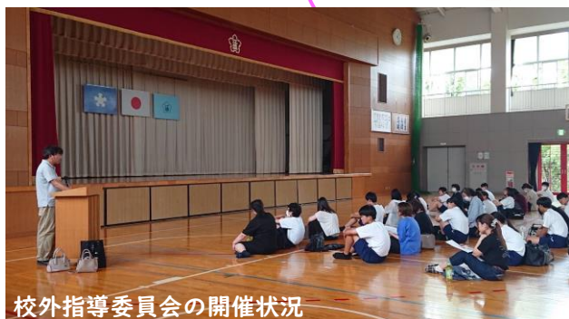
校外指導委員会の開催状況