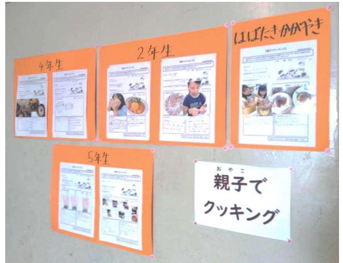
掲示した親子クッキングレシピ

親子で一緒に活動する時間を確保するため、夏休みの宿題として「親子クッキング」を行いました。皆さん上手に作っていて、作った料理の写真を貼ってくれた家庭も多かったです。学校の玄関に親子クッキングで作った料理の写真を掲示し、全校の皆さんに紹介しました。