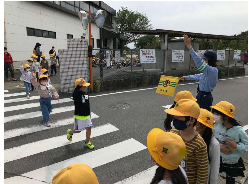
交通安全教室の様子

5月に交通安全教室を行いました。交通指導員、交通安全協会の方からお話を聞きました。1、2年生は道路の歩き方や横断歩道の渡り方、3年生は自転車に乗る前の準備や点検、ヘルメットのかぶり方、自転車の正しい乗り方を学びました。実際に道路に出て横断歩道のある交差点や道路の横断の仕方を交通指導員の方から学ぶことができました。