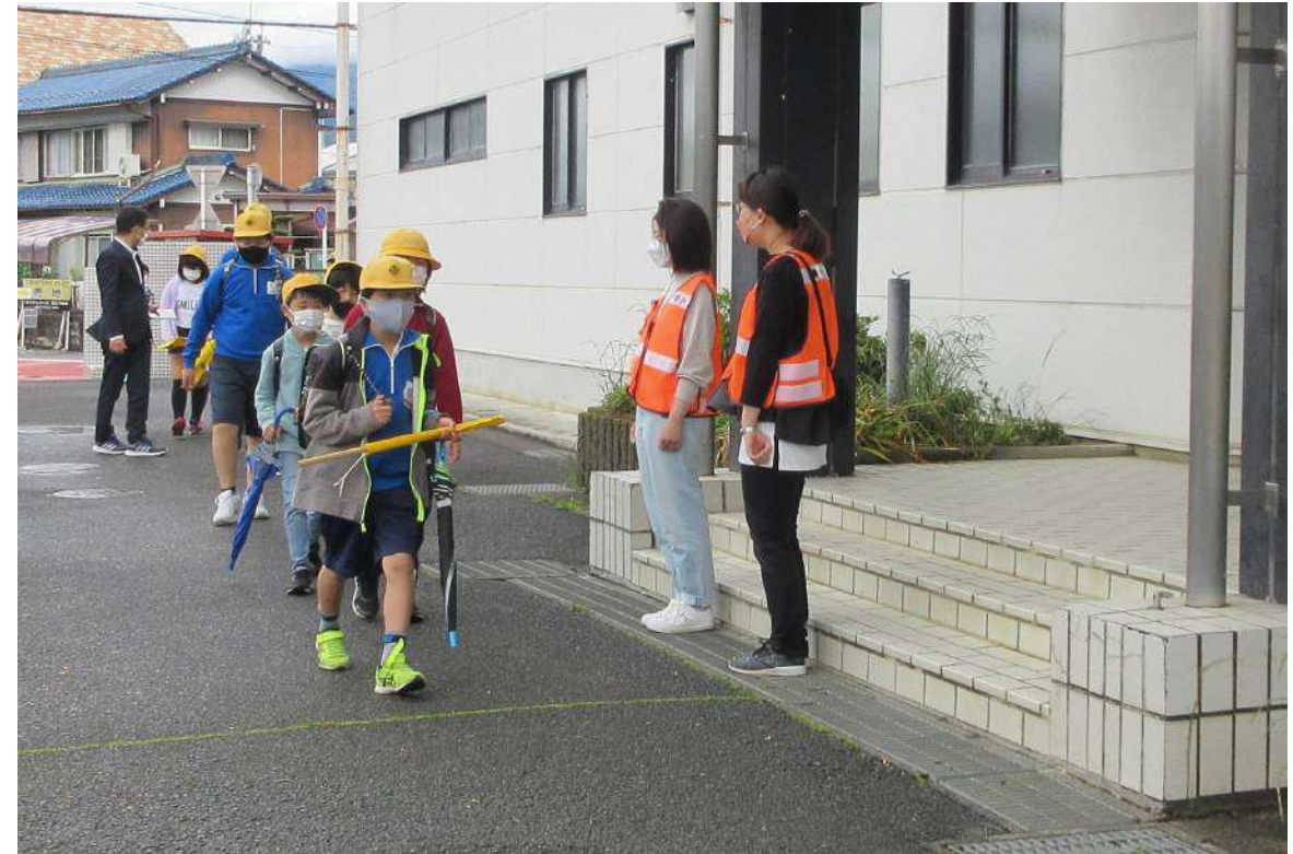
あいさつ運動の様子

月に一度、登校する子どもたちに「おはよう」のあいさつの言葉かけをしています。元気に登校する子どもたち。一人一人が大きな声であいさつしてくれます。子どもたちの元気な声を聞くことができ嬉しかったです。