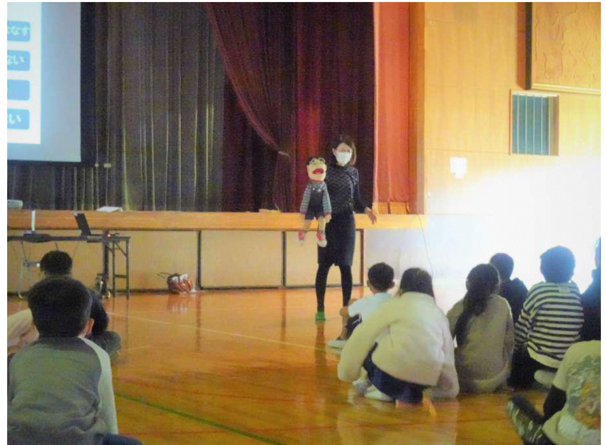
福祉講演会の様子

講師の方にお越しいただき、SNSやスマートフォン、タブレット端末を使用するときのマナーについてお話を聞きました。子どもたちにとって身近になってきたインターネット。正しい使い方をして、楽しく利用してほしいと思います。