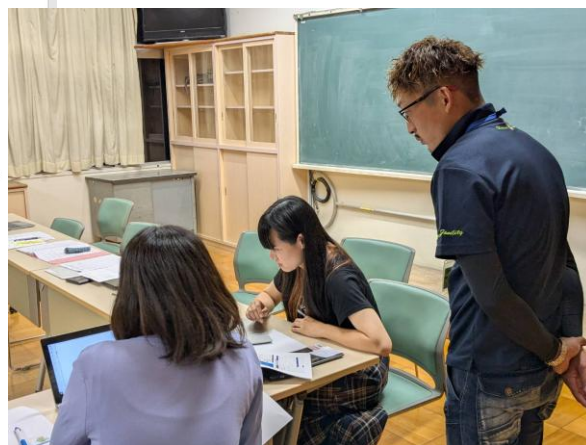
手順書を読んで、接続する練習